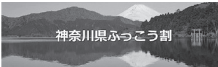
神奈川県ふっこう割

昨年9～10月、日本列島を襲った台風15号、19号は各地に大きな災害をもたらしましたが、国は被災地域の復興支援策の一環として、これらの地域の観光需要を喚起するため、昨年末から「ふっこう割」制度をスタートさせました。対象地域への国内外の旅行・宿泊者が一人一泊で最大5,000円の割引を受けられるようにする制度です。東北・関東・甲信越静の14都県が対象で、財源は全額国が負担。台風19号で災害救助法の適用を受けた被災地を持つ神奈川県でも19市町村で実施されています。期間は2月28日まで(支援金が予算額に達した場合はその時点で終了)です。