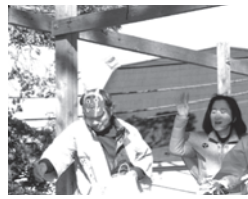
滝頭八幡神社新春豆まき