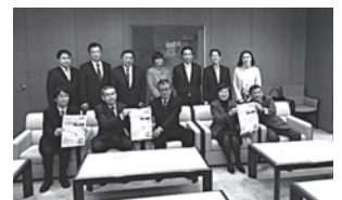
全日本ろうあ連盟・神奈川県聴覚障害者連盟の皆さんが手話言語条例可決の御礼に表敬訪問。