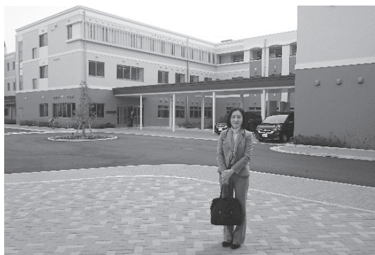
山岳スポーツセンター

また、今月オープンした子どもの自立を一体的に支援する子ども自立生活支援センター「きらり」の開所式に出席しました。