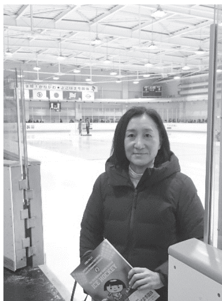
第73回国民体育大会冬季大会アイスホッケー競技会の観戦。神奈川県は総合4位でした。