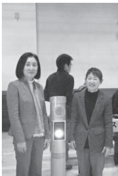
磯子区商店街連合会 新春の集い。新年会は2月に入っても続きました。

横浜ラポールで開催された視覚障がい者日常生活用具・便利グッズ展示体験会。高齢者・視覚障がい者用LED付音響式信号機も展示されていました。