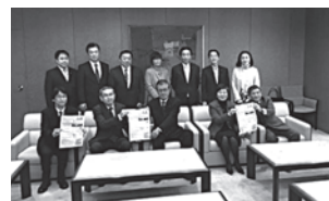
全日本ろうあ連盟・神奈川県聴覚障害者連盟の皆さんが手話言語条例可決の御礼に表敬訪問。