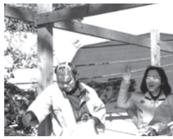
滝頭八幡神社新春豆まき