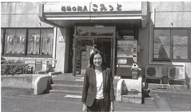
藤里町社会福祉協議会引きこもり等自立拠点支援「こみっと」